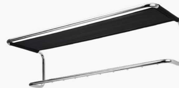
S 1520 MIT KLEIDERHAKEN/ WITH COAT HOOK