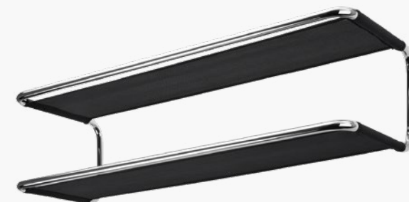
S 1521 AUCH ALS SCHUHABLAGE NUTZBAR/ ALSO USABLE AS A SHOE SHELF