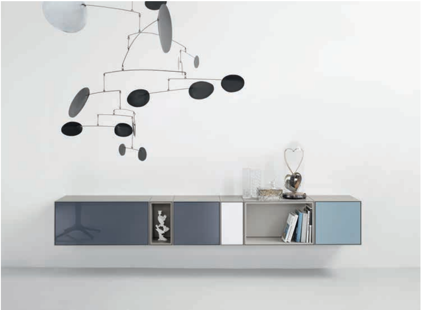
Schönheit im Sechser-Rhythmus: 6 Hängeboxen außen in Mattlack silk, Fronten in Hochglanz. Höhe 37,5 cm, Breite 260 cm. Beauty in six-packs: 6 suspended boxes with matt lacquer silk exteriors, high-gloss fronts. Height 37.5 cm, width 260 cm