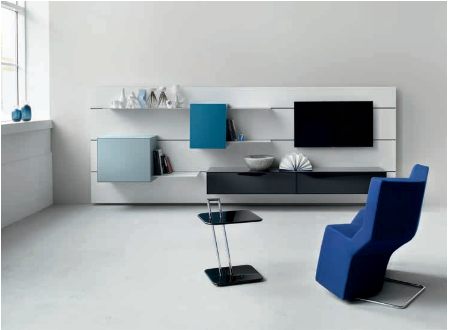
Spannungsreiche TV-Paneellösung aus Boxen und Steckböden. Exciting TV panel solution comprising boxes and boltless shelves.