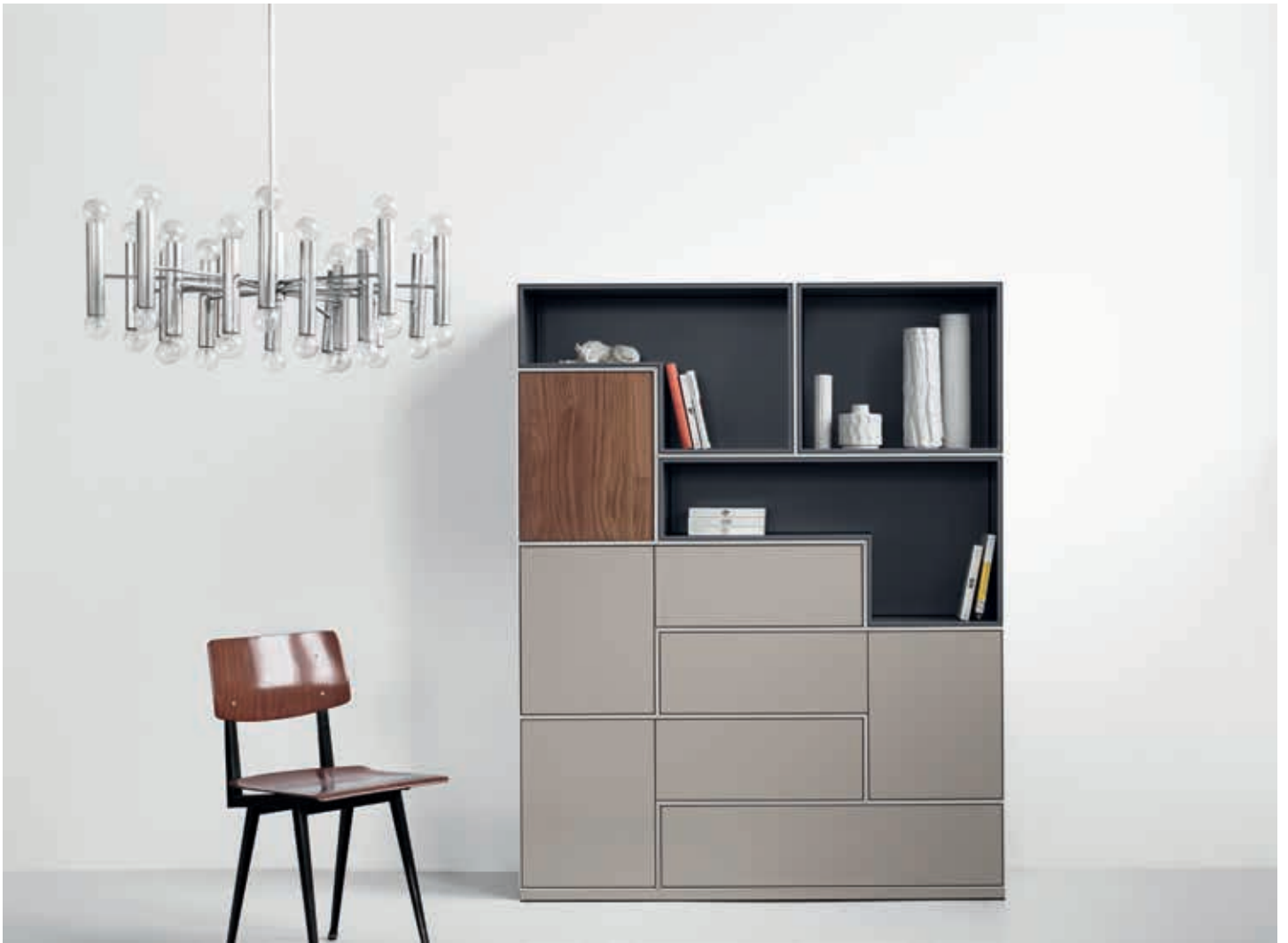
8 Boxen nach Wunsch. Boxen in Mattlack light grey mit Fronten in Mattlack desert und Vollholz Nussbaum, offene Box in Mattlack blue grey, bündige Bodenplatte. Höhe 178 cm, Breite 140 cm. 8 boxes as desired. Exterior colour matt lacquer light grey with front colors in matt lacquer silk and solid wood walnut and open boxes in matt lacquer dark grey on flush base plate. Height 178 cm, width 140 cm.